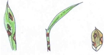
পাতা, খোল বা বীজের গায়ে দাগ পড়বে