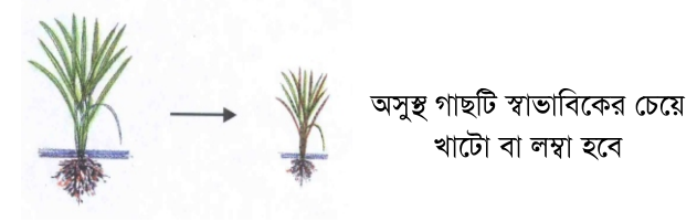
অসুস্থ গাছটি স্বাভাবিকের চেয়ে খাটো বা লম্বা হবে