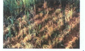
একটি মূখ্য রোগের লক্ষণ

যেসব রোগ ফসলের ফলন কমিয়ে আর্থিক ভাবে ক্ষতিগ্রস্থ করে বা করার ক্ষমতা রাখে।